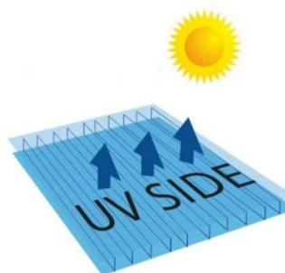
FATA PROTEJATA UV

Se recomanda ca indepartarea foliei inscripționate sa se faca dupa pozitionarea finala in cadrul montajului.